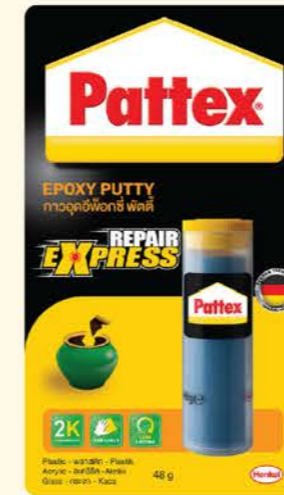
ขนาดบรรจุ : 48 กรัม