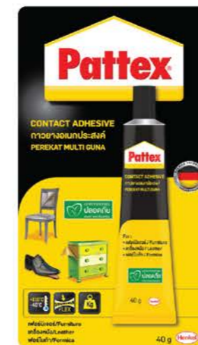
ขนาดบรรจุ : 15 กรัม, 40 กรัม