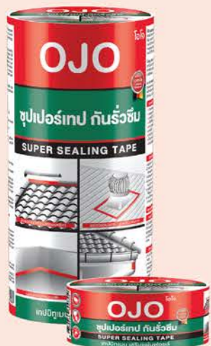
ขนาด : 28 ซม. x 3 ม. และ 5 ซม. x 5 ม.