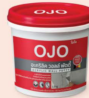
ขนาด : 1.5 กก.