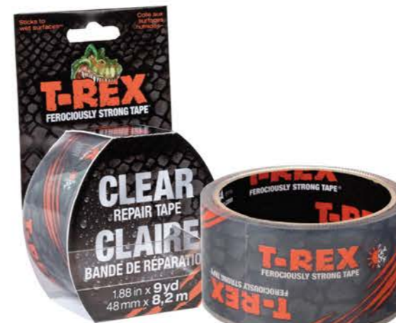
ขนาด 1.88 นิ้ว x 8.2 เมตร

ติดได้ติดกับทุกวัสดุแม้จะเปียกชื้น ทั้งงานภายในและภายนอก * *ผลลัพธ์ขึ้นอยู่กับสภาวะพื้นผิววัสดุ