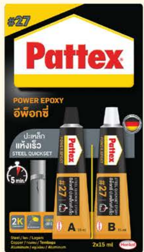
ขนาดบรรจุ : 2x15 ml.