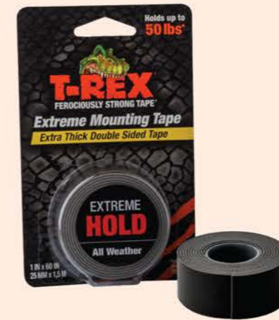
ขนาด : 1 นิ้ว x 1.5 เมตร

ติดแน่น ติดทน ใช้ได้ทั้งงานภายในและภายนอก ติดได้กับวัสดุทุกประเภท