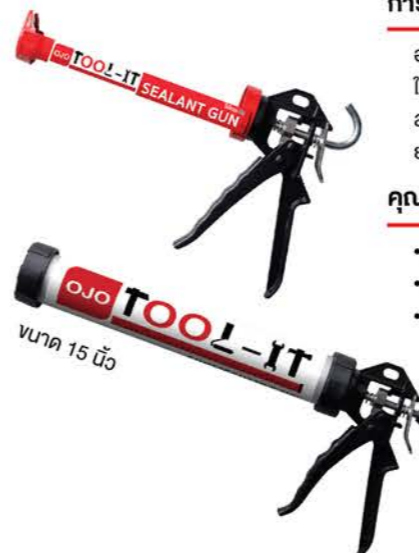
ขนาด 15 นิ้ว