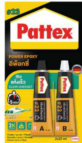
ขนาดบรรจุ : 2x15 ml.