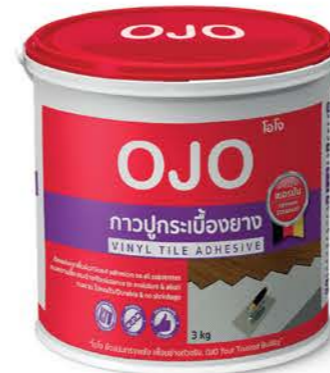
ขนาด : 3 กก.