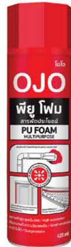
ขนาด : 420 มล.