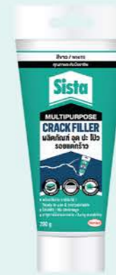
ขนาด : 290 กรัม