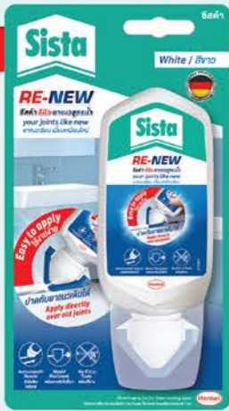
ขนาด : 100 กรัม