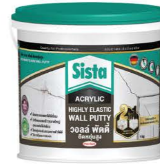
ขนาด : 1 กก. และ 4 กก.