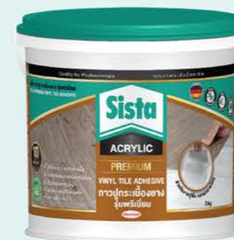
ขนาด : 3 กก. และ 18 กก.